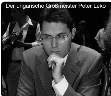
Der ungarische Großmeister Peter Leko